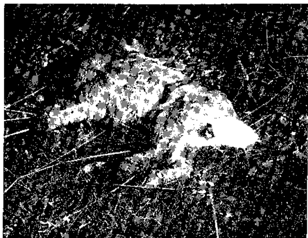
Lapin tué par la Myxomatose.