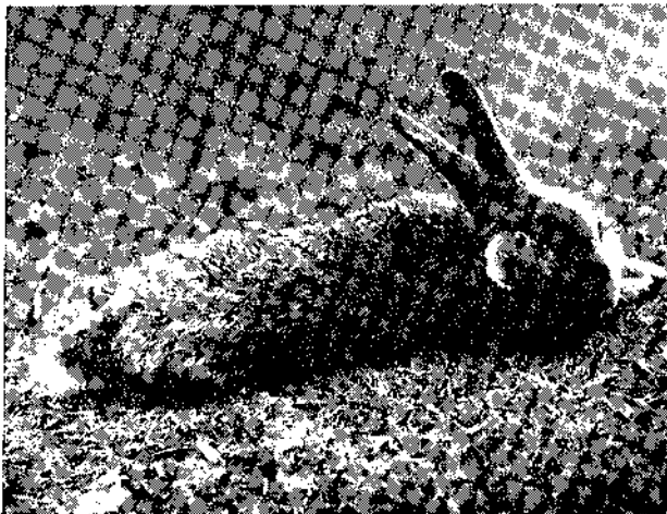
Lapin atteint par la Myxomatose.