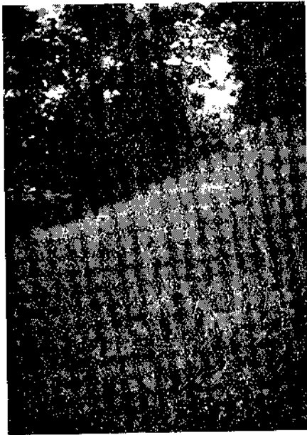
A Maillebois, cette partie en pente, véritable réserve de garennes, autrefois dénudée, est en voie de régénéscence.

« C'est pourquoi, nous inspirant de la méthode réalisée par l'Institut Pasteur pour la destruction des rats qui emploie avec succès une souche microbienne strictement et exclusivement pathogène pour ces petits rongeurs, le « typhus murium de Danicz » nous avons cherché à utiliser un virus qui fût lui aussi spécifique du lapin et non pathogène pour les autres espèces